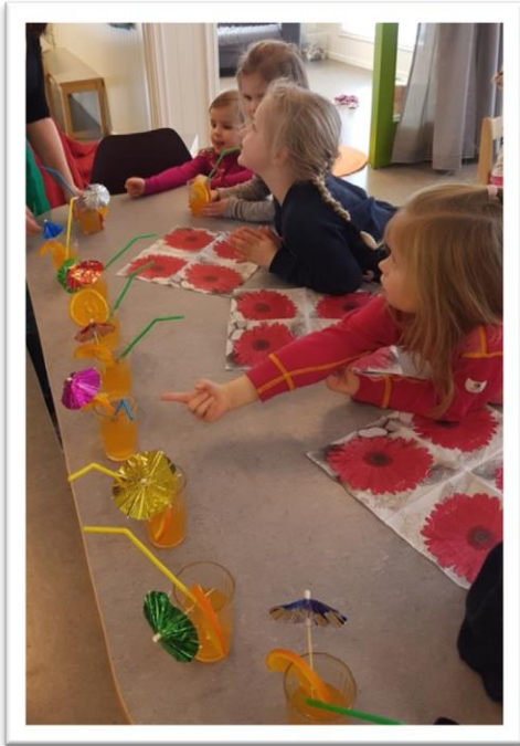
I «Syden» er det paraplydriker!