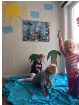
I Syden er det strand og sjø!

Det kreves gjerne et tverrfaglig samarbeid for å komme tidlig inn og gi tilpasset hjelp. Utfordringene barnet har kan være sammensatte slik at flere faginstanser må bidra. Andre ganger kan det være noen av barnets familiemedlemmer, som er årsaken til barnets vansker. Da må kanskje hele familien få hjelp til å håndtere vanskene. Komplekse forhold gjør at barnehagepersonalet må samarbeide med flere samtidig, for eksempel: PPT, helsesøster, barnevern, psykiatrien, StatPed osv.