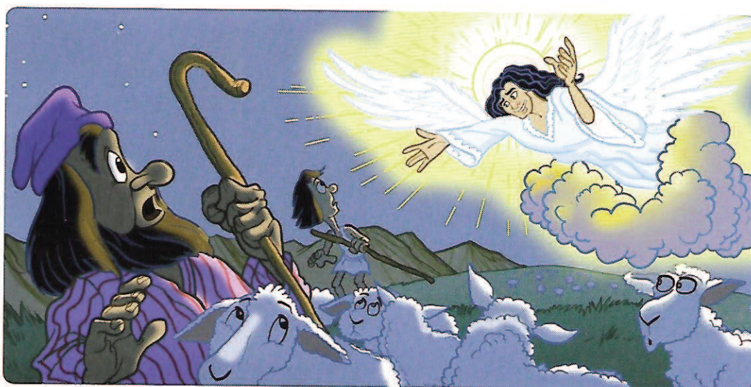
Tegning: TREVOR KEEN