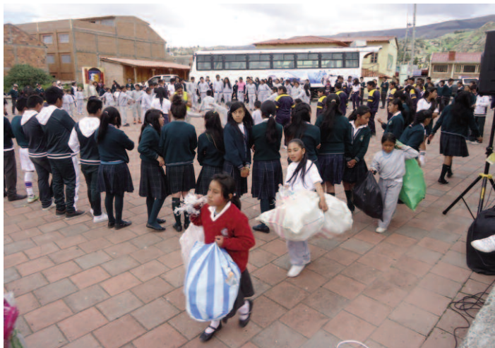
Her kommer elevene på Mushuk Kawsay til konkurransedagen med flaskene de har samlet.

På skolen i Shushilcon hadde de også fest i september. Da overrakte Mushuk Kawsay kjøleskap og ovn for kakesteking i tillegg til en liten forsterker med mikrofon på vegne av givere fra Norge. Nå ville eleven og lærerne takke og da laget de fest. Klassene hadde forberedt sanger, drama og danse-opptrinn. En av de yngste klassene dramatiserte en