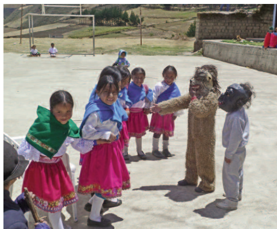
Det går greit når alle kan være venner.

barnelek som kanskje kan sammenlignes med «Haien kommer». Alle går i ring mens de synger at de leker i skogen og så roper de til ulven og spør hva han gjør på. Han svarer at han står opp, eller kler på seg, eller..... og til slutt svarer han at NÅ KOMMER HAN. Og så flykter barna til alle kanter. Men denne gangen hadde barna forberedt en vri. For etter ulven kom en gorilla og skremte ulven, så ble alle venner og laget en felles ring mens læreren fortalte hvor viktig det er at vi er venner.