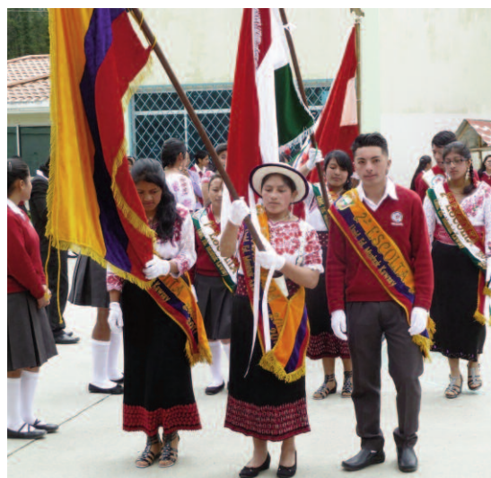
Beste elever i avgangsklassen 2016/2017.