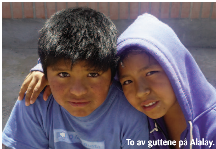
To av guttene på Alalay.

Yngres starter opp igjen tirsdag 30. august kl 18.00 på Lensvik bedehus. Der kan du spille brettspill, bordtennis, biljard, skyte med luftgevær, eller bare sitte og prate. Det er boller og saft, utlodning og en spennende andakt.