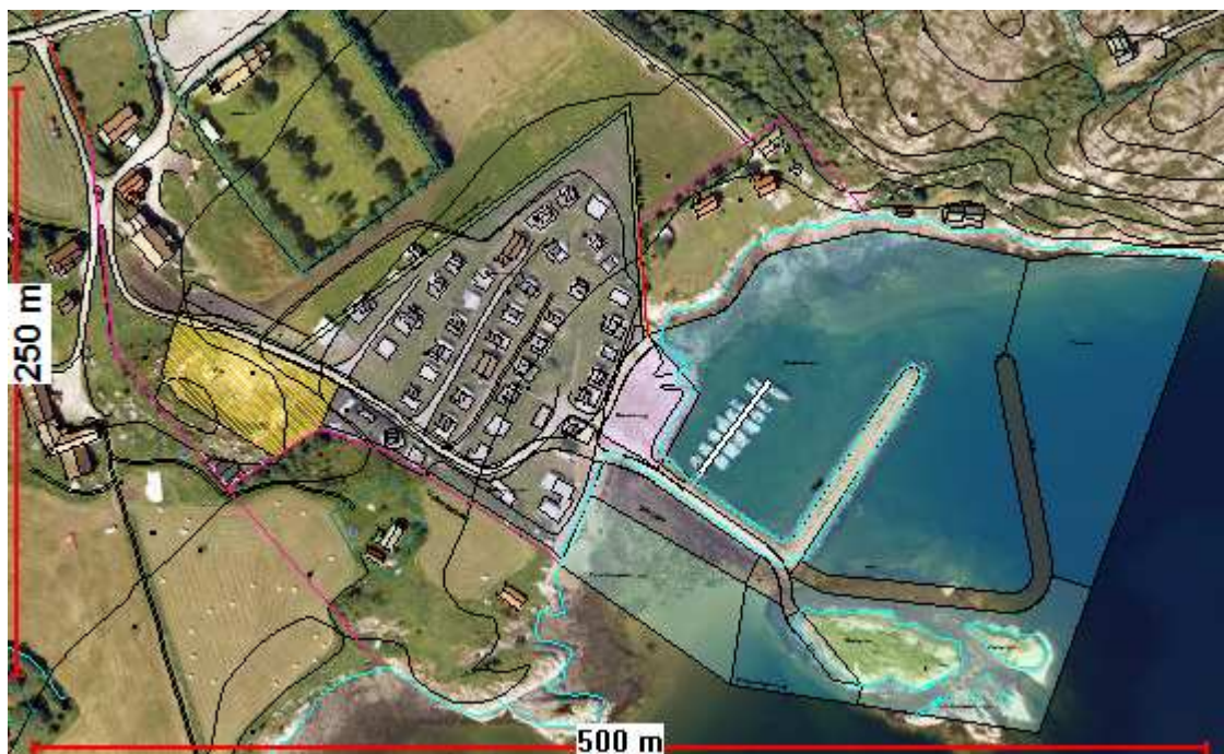
Kartutsnitt som viser planområdet ved Værnes camping og småbåthavn

Om noen år vil driften av gården Værnes Østre være inne i et generasjonsskifte. Denne planendringen er et forsøk på å legge til rette for arbeid og inntekter for framtidige generasjoner som skal overta gården. Jordbruket i seg selv er ikke tilstrekkelig til å oppnå dette. Det forventes at framtidig besøkende på turistanlegget ønsker et variert tilbud, god service og ordnede forhold på campingplassen. Et moment for framtiden er også at kommunen ønsker å begrense antall flytebrygger og småbåtanlegg rundt om i kommunen og heller legge opp til å samle disse på færre og større enheter. Omsøkte plan vil kunne imøtekomme disse ønsker.